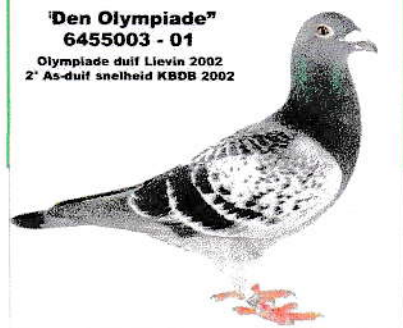
'Den Olympiade' 6455003 - 01 Olympiade duif Liévin 2002 2° As-duif snelheid KBDB 2002

M:2012/6326694 Zuster van 209-12 Olympic- Sperwer Olympiade duif Nitra 2013 1é-2032d 1é-2023d 1é-1512d 1é-1509 3é-1249d 3é-890d 4é-555 moeder van 126-15 als jong gekwest aan veugel, 4/729d 16/1952d 21/642d 31/1046d 42/1759d 46//873 59/1657d 73/1596d 80/1001d 103/1224d